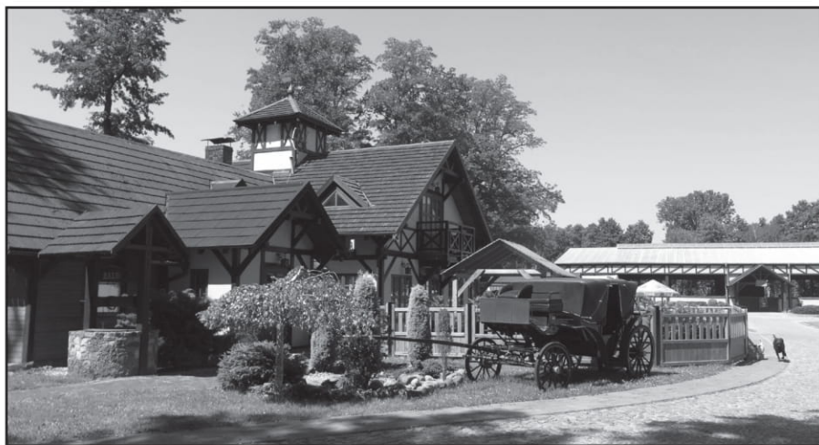
Ośrodek Jeździecki Kalumet może pochwalić się również krytą ujeżdżalnią