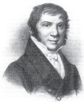
Karol Kurpiński 1785-1857