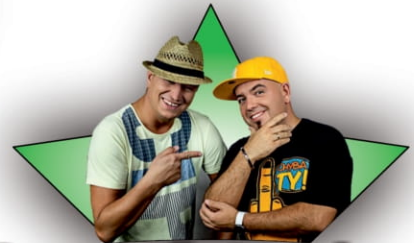
Long & Junior