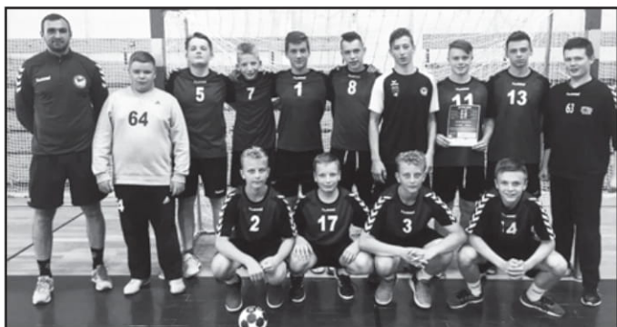
Reprezentacja SPR Włoszakowice w kategorii Młodzik

Poszczególne zespoły radziły sobie w tegorocznych rozgrywkach z dość zmiennym szczęściem. Chęci walki i zaangażowania nie brakowało jednak nikomu, a najważniejszy jest fakt ciągłego doskonalenia swoich umiejętności, praca nad kondycją i wytrzymałość w tym, co młodzi szczypiorniści robią. Bowiem piłka ręczna, choć jest dyscypliną piękną i widowiskową, to niewątpliwie trudną i wymagającą od zawodników najwyższego kunsztu.