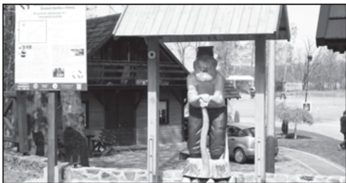
Rzeźba przedstawiająca słynnego Bartka z Piekła – przy niej zaczyna się oba warianty proponowanej przez nas trasy do Kopca Wilsona

Najcieplejsza pora roku jest już z nami i do Boszkowa zaczynają przybywać całe rzesze turystów z różnych stron Polski. Zarówno im, jak i stałym mieszkańcom gminy Włoszakowice, chcemy zaproponować nie tylko wypoczynek nad wodą, ale też poznanie naszego regionu. Dlatego też zapraszamy na wycieczki piesze lub rowerowe po najbliższej okolicy.