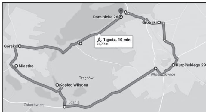
Mapka poglądowa trasy rowerowej