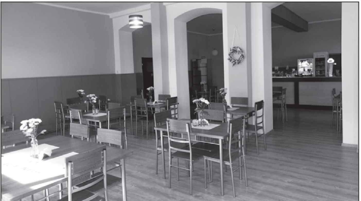
W nowym wnętrzu „Kotwicy” postawiono na stylowe odcienie szarości, przystosowując lokal do współczesnych standardów