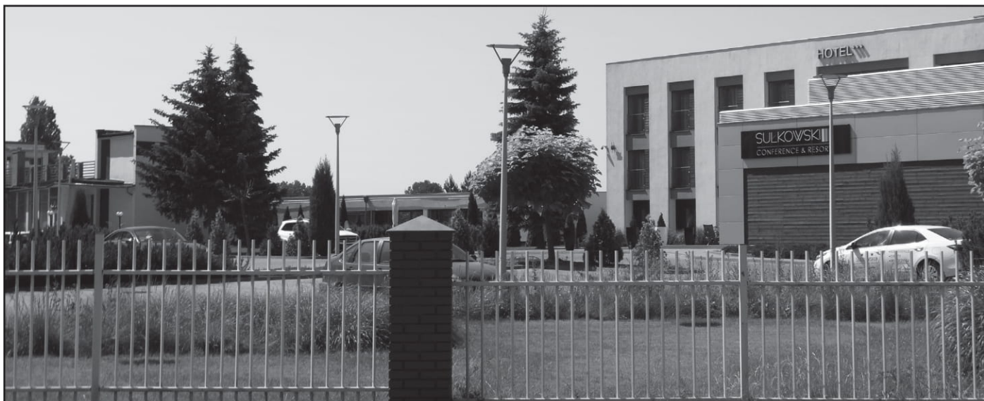
Niewielki fragment okazałego kompleksu hotelu Sulkowski

Kiedy już wiemy, gdzie spędzić noc, czas poznać inne zakamarki tego bajkowego miejsca. Takie elementy krajobrazu Boszkowa jak lasy, jezioro, piasek i urokliwe dróżki, przywołują na myśl nie tylko ułożenie się na kocu, w ciepłym blasku słońca, ale również aktywne spędzanie czasu. Obok wielu dróg, które można spożytkować na długie spacery czy przejażdżki rowerowe, w okolicy znajduje się jeszcze Ośrodek Jeździecki Kalumet , zlokalizowany przy ulicy Żeglarskiej 1A. Kalumet funkcjonuje przez cały rok, a w okresie letnim organizuje dodatkowo trzynastodniowe obozy jeździeckie dla dzieci i młodzieży. Oprócz obozów znajdziemy tutaj także bogatą ofertę dla klientów indywidualnych. Stanowią ją jazda konna na lonży (specjalnej kilkumetrowej linie), na placu oraz w terenie. Można też skorzystać z przejażdżek wozami zabierającymi do 10 osób. Jest to z pewnością bardzo przyjemny sposób zwiedzania okolicy. Ośrodek oferuje ponadto możliwość organizacji różnego rodzaju imprez plenerowych. Doskonałym