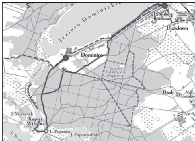
Mapka poglądowa trasy pieszej

dydaktyczna skręca w prawo w las, my idziemy dalej prosto i docieramy do Dominic, skąd asfaltem wracamy do Boszkowa.