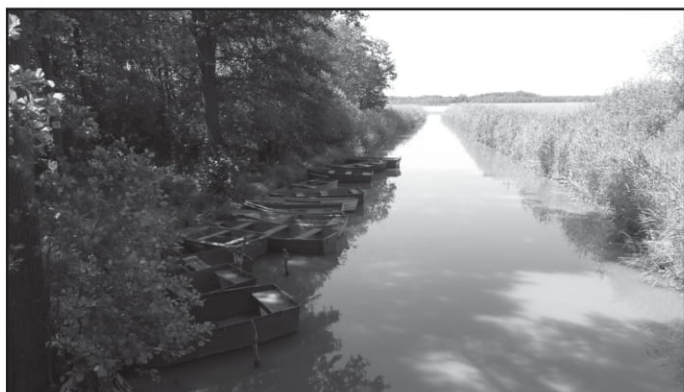
Odcinek Szlaku Konwaliowego łączący Jeziora Wielkie i Małe