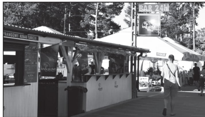
W Klubie na Fali, oprócz świetnej rozrywki, czeka na nas również prawdziwy turecki kebab